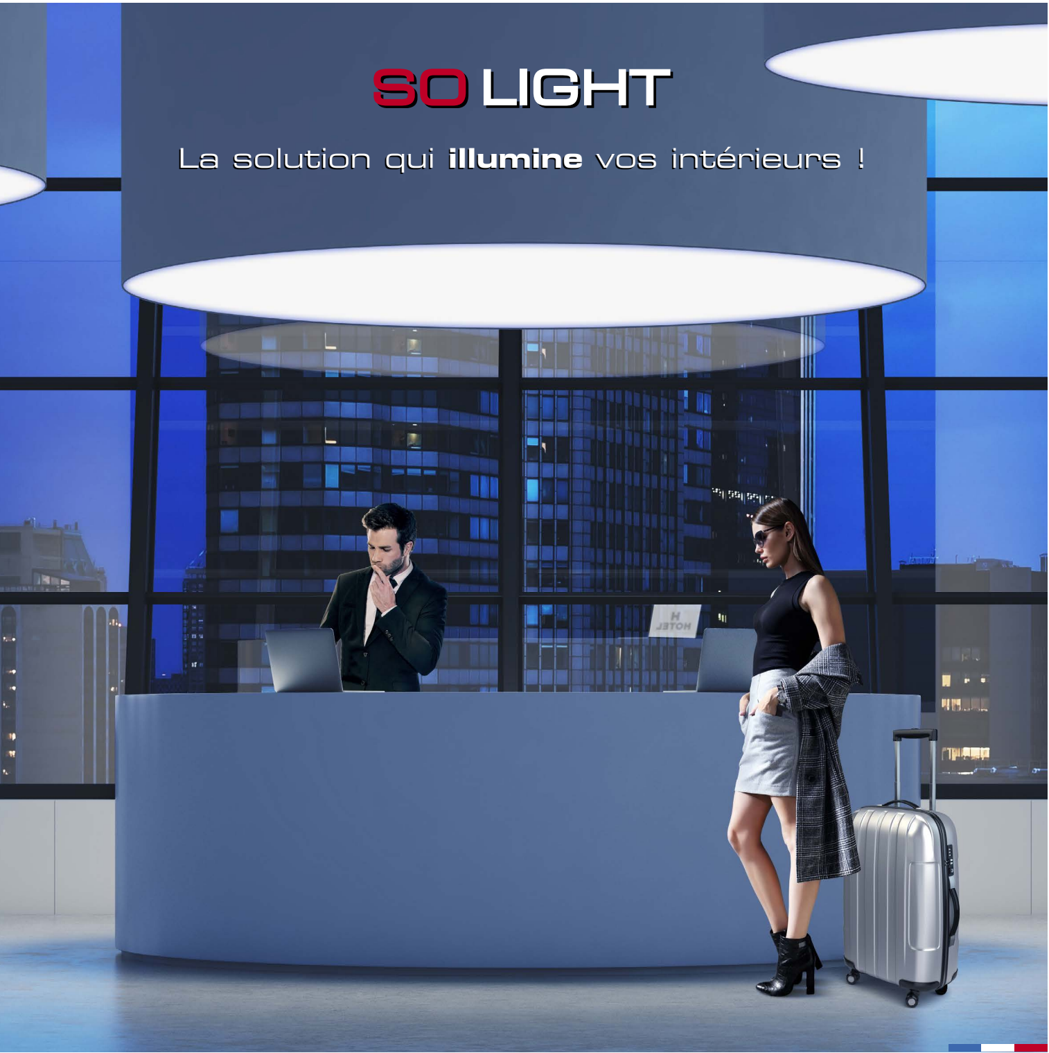
Made in France

Ed. 09/2022. Photos non contractuelles. Tous droits de modifications réservés.