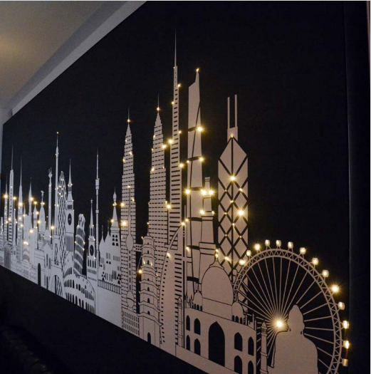
Mur imprimé avec fibre optique intégrée France - Réalisation : CLIPSO PRODUCTION

Embarquez dans les étoiles avec les fibres optiques intégrées dans nos toiles ! Aux murs ou aux plafonds vous créez ainsi une ambiance unique qui fait rêver.