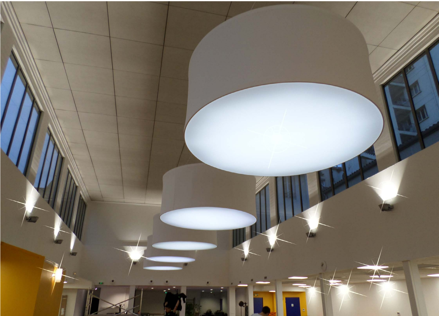
Centre commercial - Luminaires XXL en structures aluminium - Toiles rétroéclairées - France - Réalisation : SPIDER DESIGN

La lumière nous est nécessaire, vitale même : elle régule notre organisme et notre humeur.