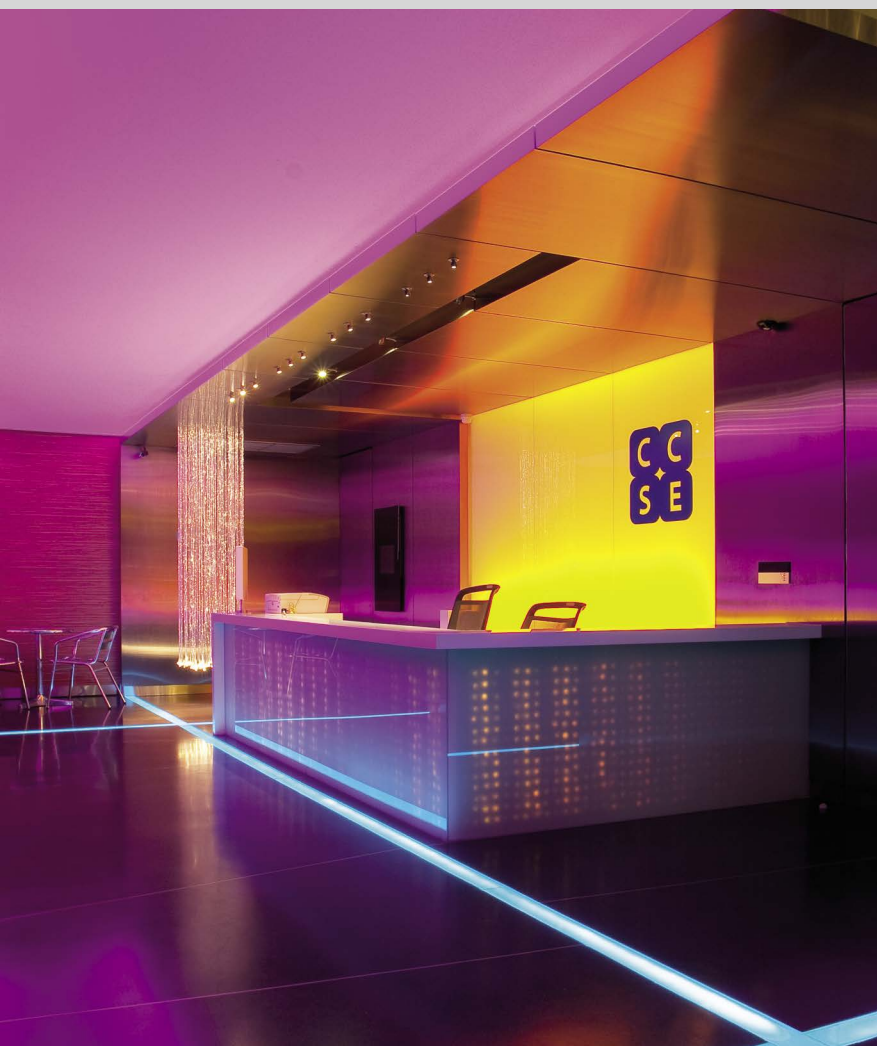
Bureaux - Thaïlande - Revêtements rétroéclairés RGB - Réalisation : CCSE

Certains espaces publics sont désormais pensés pour que l'acoustique soit la plus agréable possible, centres commerciaux dans lesquels le bruit omniprésent doit être atténué, ou cabinets médicaux où la discrétion est nécessaire.