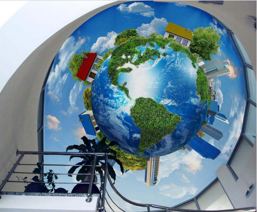
Plafond trompe l'oeil rétroéclairé - Allemagne Réalisation : Baumann