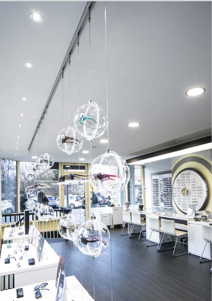
Magasin d'optique - Intégration de spots et caissons rétroéclairés - Allemagne - Réalisation : Optimaler

Embellissez tout votre espace avec un effet lumineux qui simule la lumière du jour.