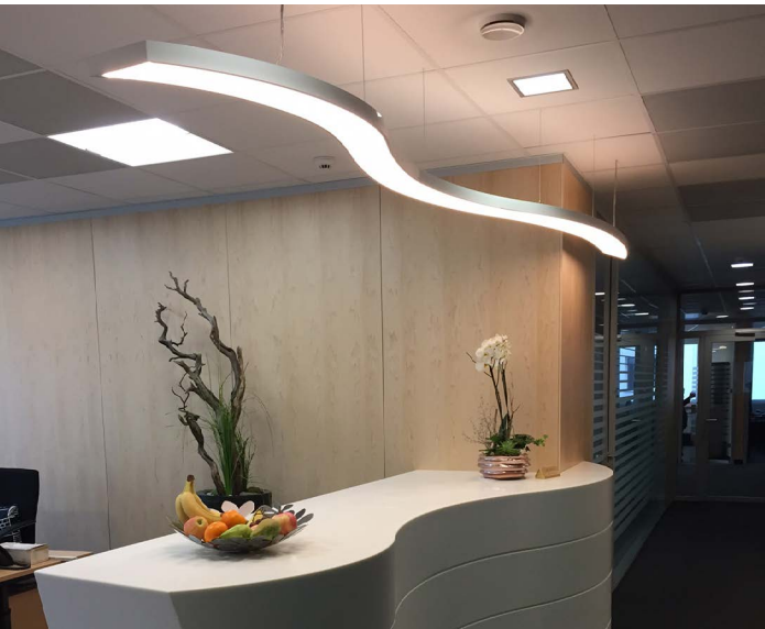
Structures aluminium rétro-éclairées - Luminaire Suisse - Réalisation : Linsi-tech

Envie de jouer sur l'intensité lumineuse ou les couleurs ? Là encore l'association d'un certain type de LED vous permettra de créer cette ambiance personnalisée douce et chaleureuse.