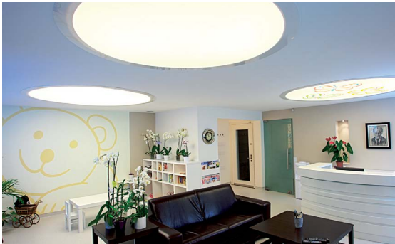
Clinique Dentaire - Plafond avec cercles rétroéclairés

La lumière nous est nécessaire, vitale même : elle régule notre organisme et notre humeur.