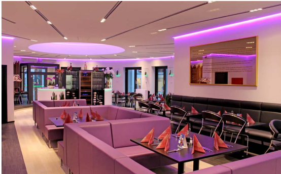
Restaurant - Plafond acoustique avec intégration de chemins lumineux et rétroéclairage - Danemark Réalisation : RALBO

Il est donc indispensable aujourd'hui de l'adapter à nos intérieurs, qu'ils s'agissent de son lieu de travail comme de son "chez-soi", pour évoluer dans une ambiance agréable et qui nous ressemble.