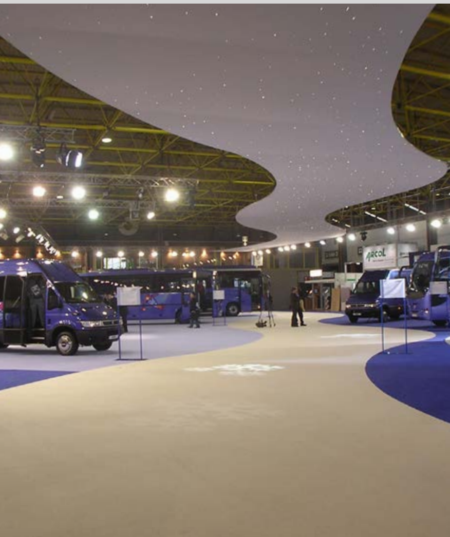
Stand IVECO - Plafond avec intégration de fibre optique