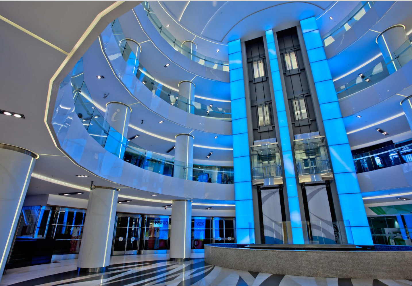
Centre commercial Akmerkez - Turquie - Revêtement rétroéclairé - Architecte : Filiz Yilmaz - Réalisation : TTI Elektrik Elektronik