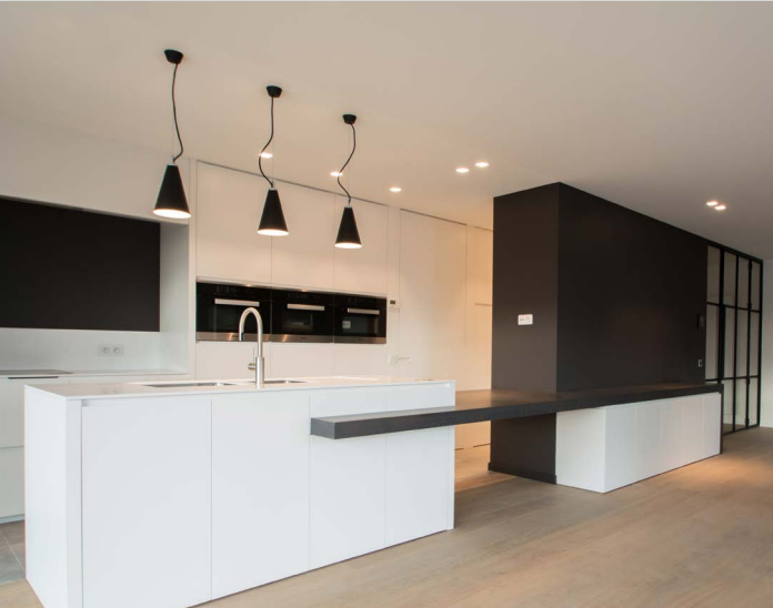
Résidentiel - Plafond acoustique avec intégration de luminaires spots - Belgique - Réalisation : MONAVIS

Mettez en valeurs vos produits dans vos magasins et showrooms avec un rendu lumineux moderne et immaculé.