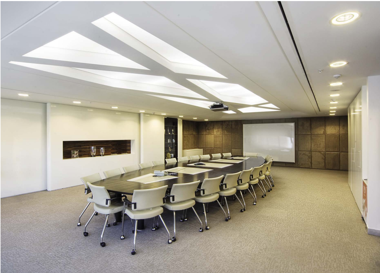
Salle de réunion UNILEVER - Plafond avec structure rétroéclairée

CLIPSO s'attache à vous accompagner au mieux à chaque étape de votre projet ; de l'équipe commerciale aux équipes techniques en passant par le design, nous mettons toutes nos compétences et domaines d'expertise à votre service.