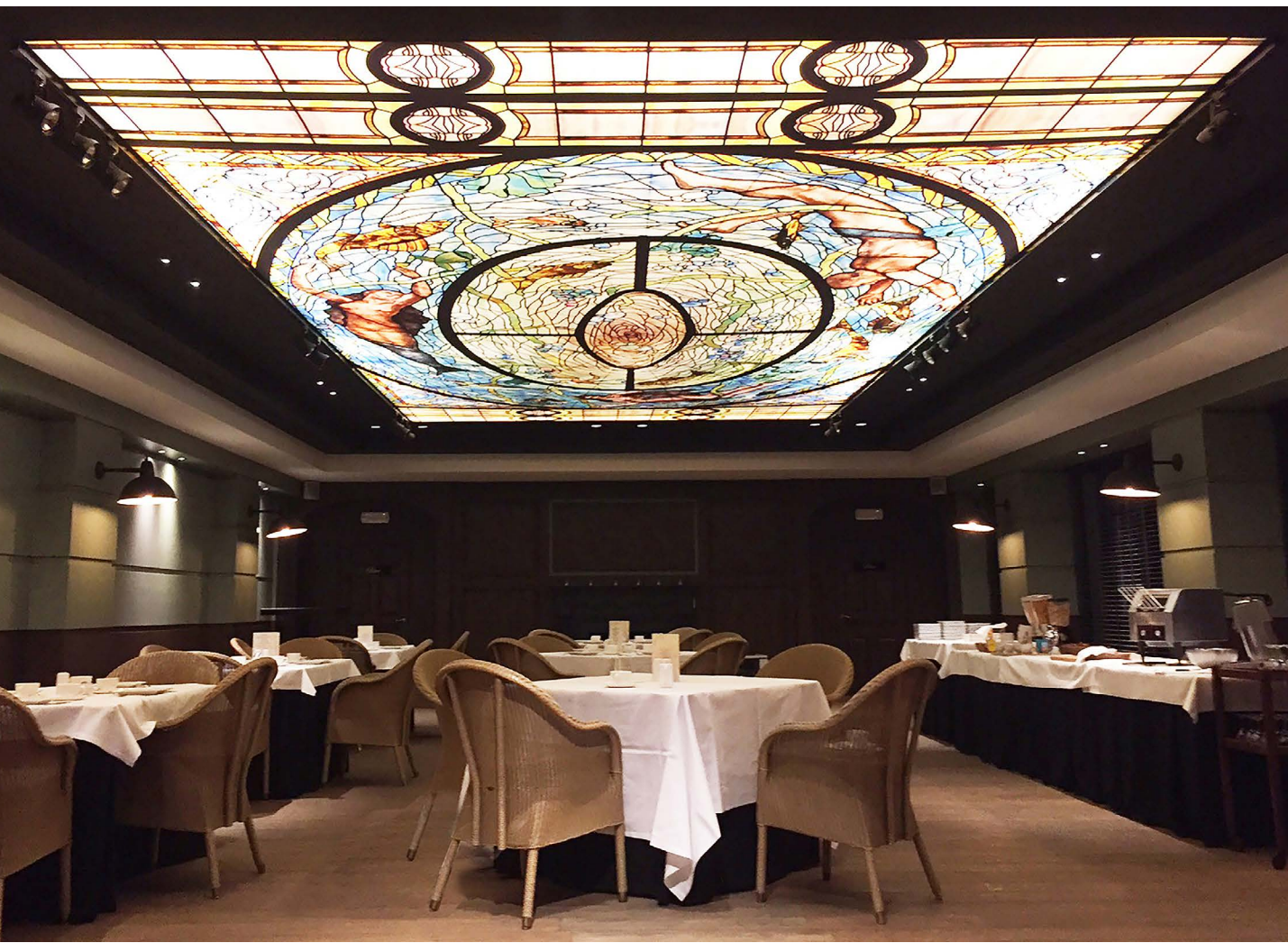
Restaurant - Belgique - Plafond imprimé rétroéclairé - Réalisation : MONAVIS